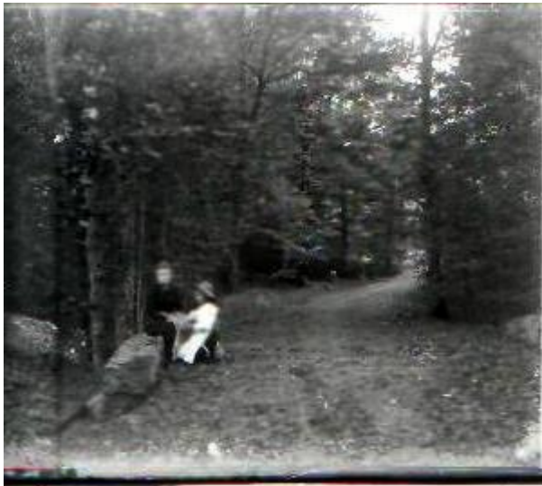
chemin de l' Etang-neuf -