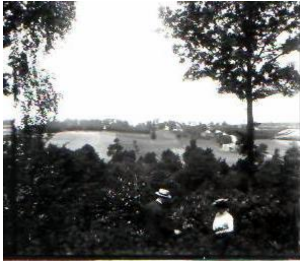
Vue de La Brette et Castel à Gouroures