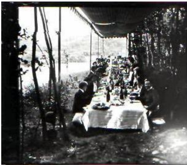
Le déjeuner en plein air.