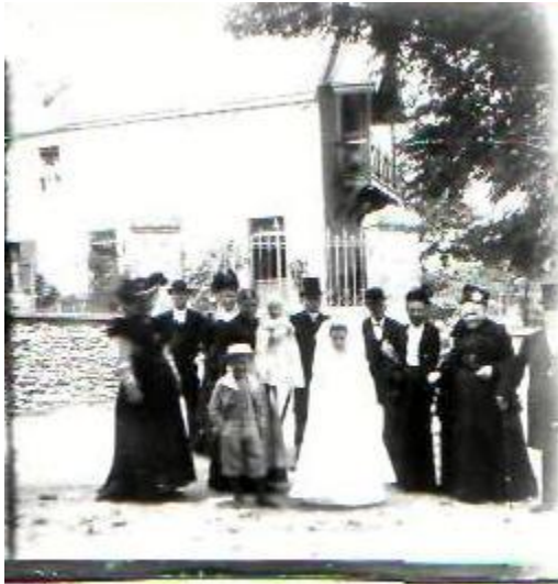
Assemblee de la Communion. Les mariés.