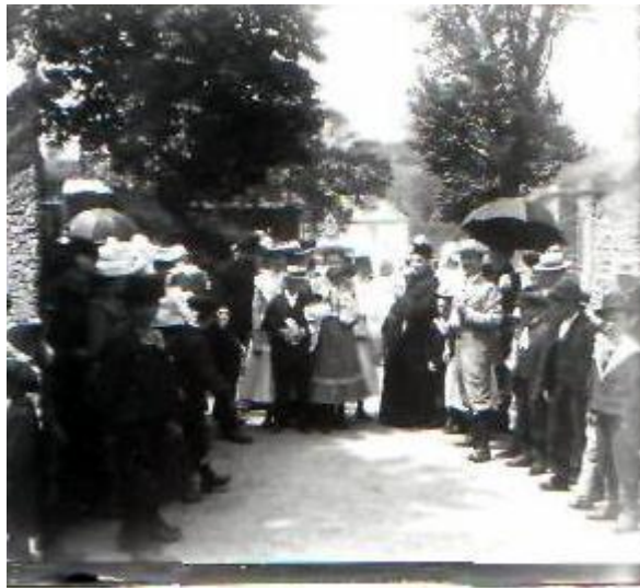
Baptême de M lle Emile à Gronowice. 31 Mars 1903.